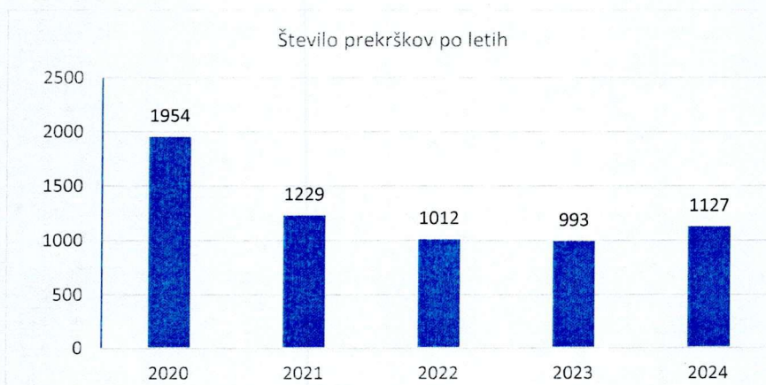
Tabela 2: gibanje števila prekrškov po letih